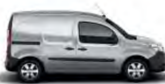
Kangoo Express et Nouveau Kangoo Z.E.