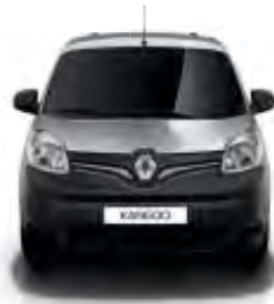
Bouclier avant/arrière et coques de rétroviseurs extérieurs grainés noirs