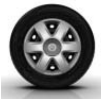
Enjoliveurs BRIGANTIN sur Kangoo Express et Z.E. à partir de Confort, Kangoo Express Maxi et Maxi Z.E.