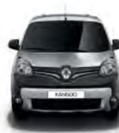
Pack Style : bouclier avant bi-ton Noir Grainé/Chrome Satiné avec projecteurs additionnels et masques de feux noirs