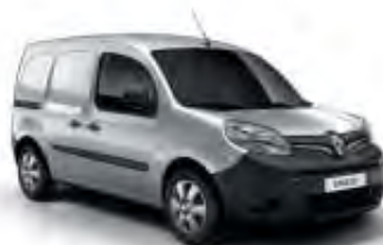
Gris Argent (TE)