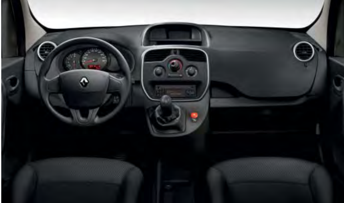
Version thermique présentée, avec option R-Plug&Radio