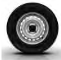
Enjoliveurs BOL sur Générique