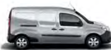
Kangoo Express Maxi et Nouveau Kangoo Maxi Z.E.