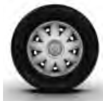
Enjoliveurs URSA sur Compact Grand Confort et Extra