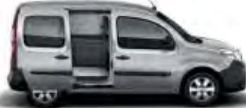
1 ou 2 portes latérales coulissantes vitrées (1)