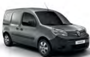
Gris Taupe (OV)