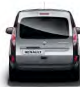
Hayon arrière vitré (2)