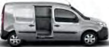
1 ou 2 portes latérales coulissantes tôlées (1)