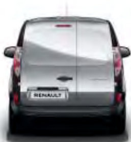
Portes arrière asymétriques tôlées