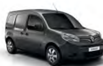
Gris Cassiopée (TE)

OV : opaque verni TE : peinture métallisée Photos non contractuelles.