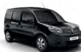
Noir Métal (TE)