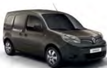
Brun Moka (TE)