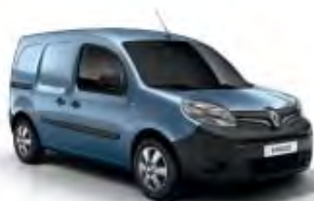
Bleu Étoile (TE)