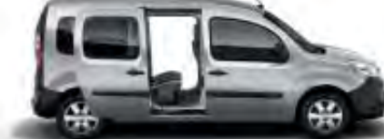
1 ou 2 portes latérales coulissantes avec espace de chargement entièrement vitré