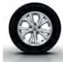
Jantes Alliage 15" ARIA disponibles en option