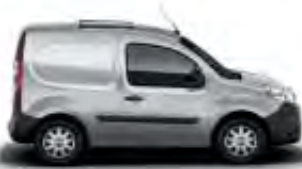
Kangoo Express Compact