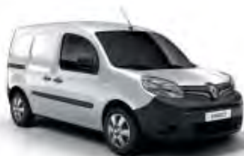
Blanc Minéral (OV)