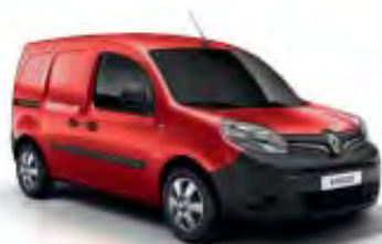
Rouge Vif (OV)