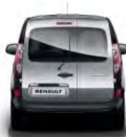
Portes arrière asymétriques vitrées avec essuie-lunette et désembuage