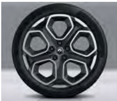
Jante alliage 19" Extrême