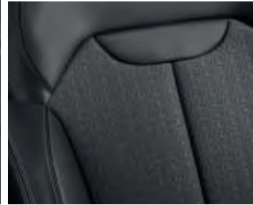
Sellerie mixte similicuir / tissu Noir Titane