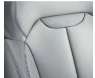
Pack cuir gris clair*