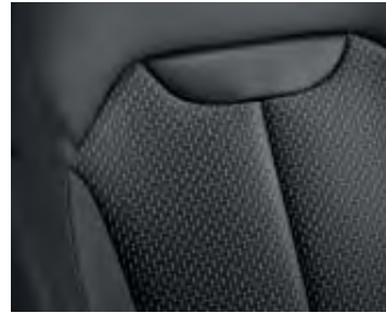
Sellerie Tissu Carbone Foncé