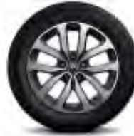
Jante alliage 17" Aquila Gris Erbé diamanté