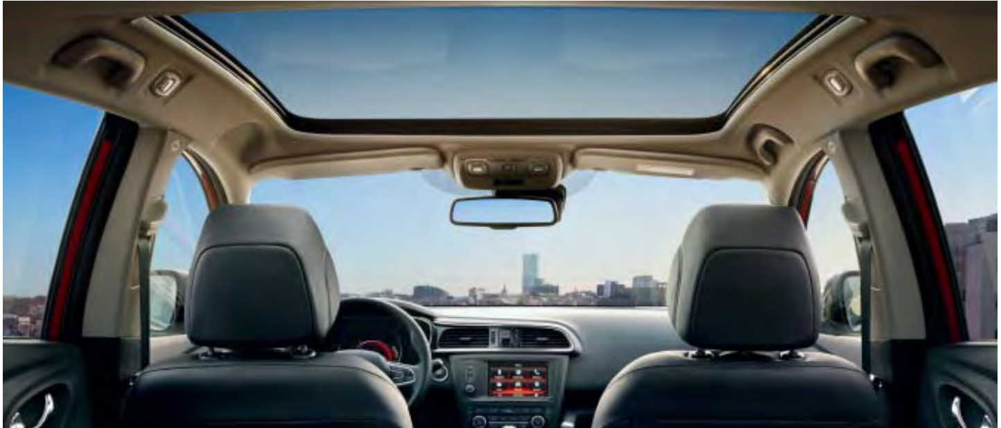
Toit verre panoramique

PASSEZ AU NIVEAU SUPÉRIEUR (OPTIONS SUR INTENS)