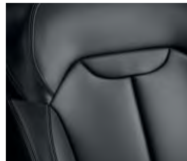
Pack cuir carbone foncé*