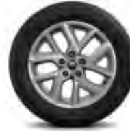
Jante alliage 17" Impulsion