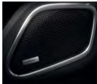
Bose® Sound System