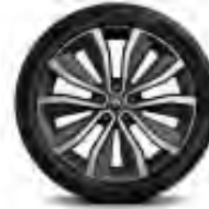
Jante alliage 19" Egeus