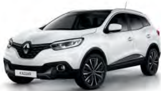
Blanc Glacier (O)